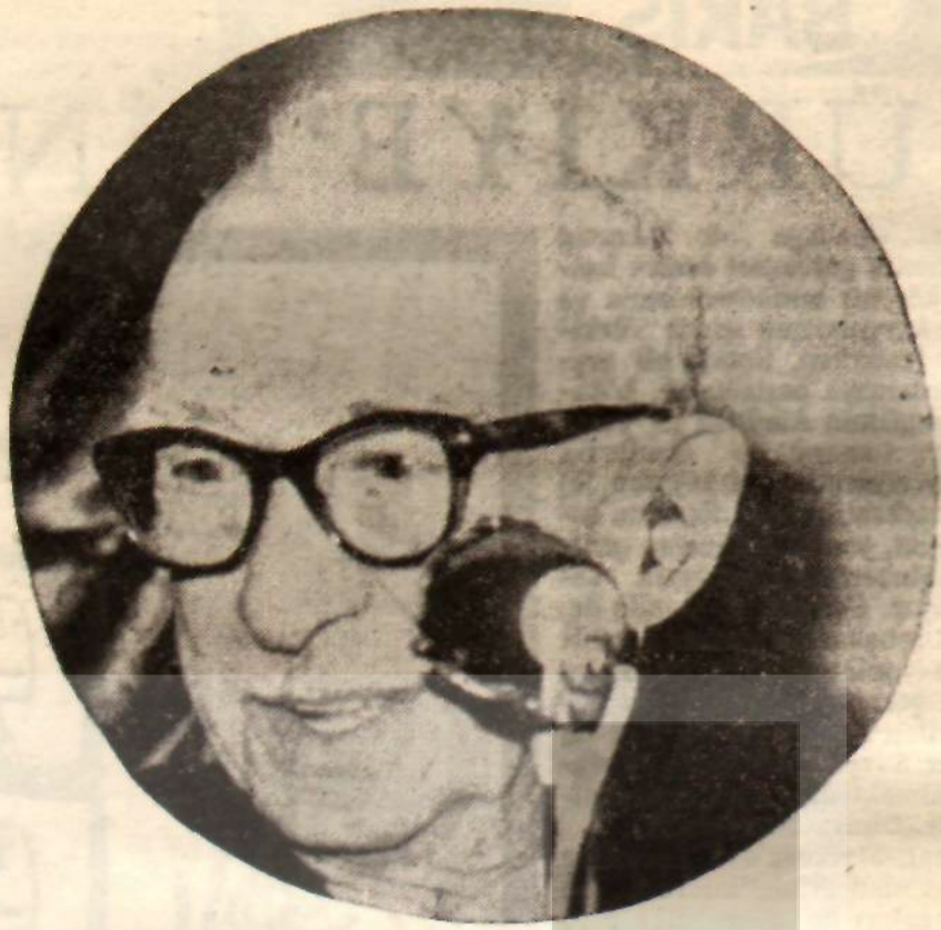
CHP Genel Başkanı İsmet İnönü «Ortanın solu» ile flörtte...

Ortanın ortasındakilerin tezini savunmak işi ise, ikili anlaşmalar konusundaki olumlu tutumunu öteki sütunlarımızda övdüğümüz Coşkun Kırca'ya düştü. Kırca, Feyzioğlu'nun genel seçimlerden sonra Parti Meclisinde «ortanın solu» deyimine karşı çıkarken ileri sürdüğü fikirleri dile getirdi. Bu arada sosyalizm konusunda gelecek sayımızda ele alacağımız, haksız ve yanlış görüşler ileri sürdü ve faydasız tahriklerde bulundu. Sanki CHP nin adını değiştirmek isteyenler varmış gibi, «CHP'nin adını değiştirmeye kimsenin hakkı yoktur» diye bağırta. Bu tahrikçi sözler bir kısım milletvekillerinin «Bunu teklif eden var mı?» sözleriyle