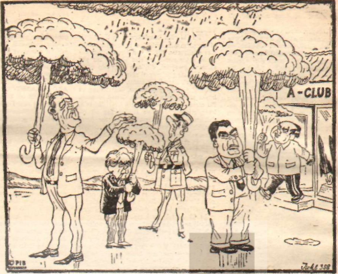
ATOM KULUBU ÜYELERİ Johnson, Wilson, De Gaulle, Brejnev, Mao

De Gaulle ufku gözden geçirirken aynı zamanda Marksist Dünya İçinde milliyetçiliğin yeniden doğduğunu görmüştür. Bu doğuş, artan Çin - Rus anlaşmazlığında belirlemektedir. General, çatışmanın ideolojik farklardan değil, büyük komşular arasındaki eski tip rekabetten ileri geldiğini düşündü. Kısmen bu rekabetteki tarafsızlığını göstermek için Pekin'i tanıdı.