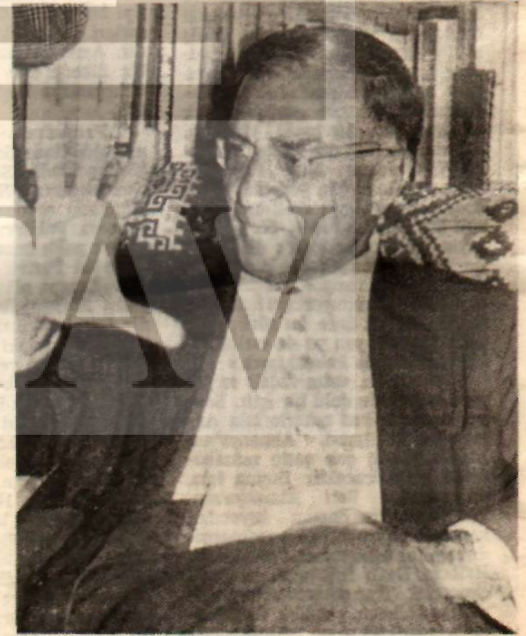
Kasım Gülek C.H.P.'yi «soldan kurtaracak mücahit»i.

CHP'ye seçim kazandıracağını söyleyen Gülek, Adanada Eylülde toplanacak Kurultay'da CHP'nin yönetimini ele geçirmek için mücadele edeceğini de söyledi. Ama Gülek'in CHP, içinde, hele İnönü'nün sağlığında, bir şans kalmış değildir. Gülek'in çıkışı yaygara ve gürültüden başka sonuç vermeyecektir. Ama bu yaygara ve gürültüden yararlanarak, ortanın ortasındakiler, Gülek tehlikesi gerekçesiyle, ortanın solundakilerin hızını kesmeye çalışacaklardır. Sağ ve solu birbirine karşı oynayarak, tesanüt gerekçesiyle ortaya çıkmak ve sağ ile solu, «ehven-i şer» ortaya razı etmek, çok denemiş ve kısa vadede ekseriya semere vermiş bir taktiktir. Ama statikoyu sürdürmekle sonuçlanacak böyle bir idare-i maslahat politikası, ne CHP'ye, ne de Türkiye'ye yararlı olacaktır.