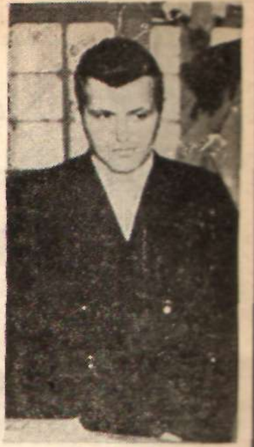
U-2 pilotu Powers

Amerika'nın meşhur yalan yalayan makinesi NSA'dadır. Fakat ne bu yalan makinesi ne de Amerikanın korkunç polis usulleri NSA'yı çin çin öten skandallardan kurtramamaktadır. NSA'nın en parlak elemanlarından Martin ve Mitchell hikâyesi kolay kolay unutulamaz-yacaktır.