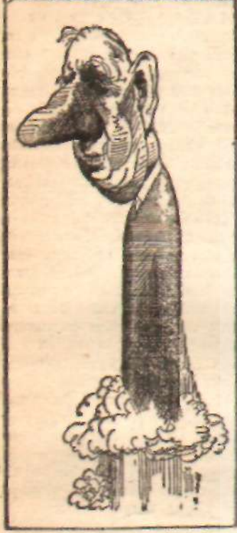
DE GAULLE FUZESİ!

De Gaulle'un muhakemesi, onu büyük bir harp olmayacağı kanısına götürdü. Zira Rus halkı böyle bir felâketten fena halde korkuyordu. Rejim de Avrupa'yı elde edemeyeceğini, ancak işgal edebileceğini biliyordu. General, buradan şu sonuca vardı: Harp korkusu, Rusya'dan değil, fakat nükleer silâhlardan doğan soyut bir korku hâline gelmiştir.